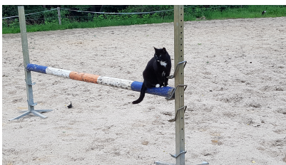
Onze lat voor de komende 5 jaar :)

binnen nu en 5 jaar kijken we of deelnemers er plezier aan hebben om groenten te verkopen, door ze het geregeld te vragen