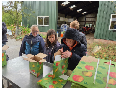
'we eten samen gezond'