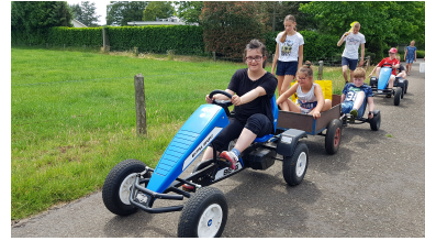
ik beweeg veel op de boerderij

Buitenkans is niet zomaar gekozen, het is voor ons en onze deelnemers een werkplek waarbij we de kans krijgen om veel buiten te zijn. Onze klussen bestaan dan ook vooral uit buiten klussen. Wanneer we een klus bedenken vinden we het belangrijk dat er voor iedereen een taakje bedacht is zodat ongeacht het niveau iedereen een bijdrage kan leveren. In het vroege voorjaar van 2025 maakten we met ons allen nieuwe moestuin bakken. Wij liepen er tegenaan dat onze jongens met maat 46 in de worteltjes stonden om tussen de sla plantjes te schoffelen, dat kon beter bedachten we met ons allen. Met als resultaat, drie grote en vier wat kleinere moestuinbakken. Het resultaat mocht er zijn en nog belangrijker; het werkte! Met plezier konden we de bakken makkelijk inzaaien en de groente die groeide goed onderhouden. Later in het seizoen hebben de deelnemers dagelijks de groente opgemaakt in een kar en verkocht aan de straat. Zo fijn om ze vol trots terug te zien komen met een handje met klein geld uit de kluis. In het najaar kregen we net als zoveel boeren of bedrijven met een publieksfunctie, te maken met een ophokplicht voor onze kippen. Ook hier konden we de handige hulp van de deelnemers goed gebruiken, samen maakten we van een quarantainestal een 5 sterren binnen verblijf. Onze kippen hebben we nog niet horen klagen.