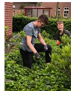
ik kan kiezen uit nuttig werk

Dat we één zijn met de natuur en hun producten blijkt ook uit de activiteit welke we nu al jaren in het najaar uitvoeren. Met de volwassen deelnemers gaan we zo'n twee á drie dagdelen appels rapen en plukken. Vervolgens gaan we de eerst volgende zaterdag met de jeugdige deelnemers naar een sapmobiël. Waar ter plekke onze eigen appels op een lopende band gaan en tot appelsap verwerkt worden. Aan het eind van de middag gaan we met zo'n 50 pakken appelsap weer richting de boerderij.