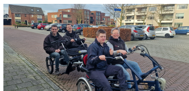
Samen Buiten Gewoon