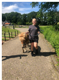
er is ruimte en ik kan veel buiten zijn