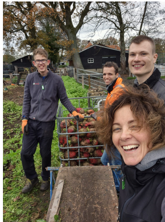
Gewoon Samen Buiten

Wat maakt een jaar nu een goed jaar? Daar nemen we jullie in mee. Wij als begeleiders spreken over goed, wanneer we tevreden deelnemers zien, er weinig verloop is, en er vooral veel gezelligheid en een ontspannen sfeer is. Dat er onderling respect is en dat ouders en verzorgers net zo tevreden zijn. Wij hechten dan ook veel belang aan de evaluatie momenten. We gaan af op ons gevoel, wat zien we en hoe reageren de deelnemers? Een één op één momentje kan helpend zijn of juist samen aan de slag en een muziekje aan. Op alle werkdagen is ons doel dat de deelnemers komen met plezier en met een goed gevoel weer naar huis gaan.