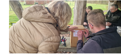
kerstballen ophangen voor het goede doel