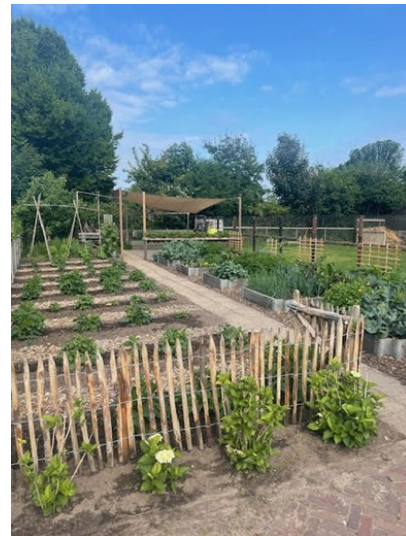
Moestuin vol verwachting lente 2025

Het jaar werd feestelijk afgesloten met een gezellige kerstviering, waarbij deelnemers, het hele team en hun introducees samenkwamen. We kijken met trots en dankbaarheid terug op een jaar waarin Villa Kakelbont opnieuw een warme en verbindende plek is gebleken.