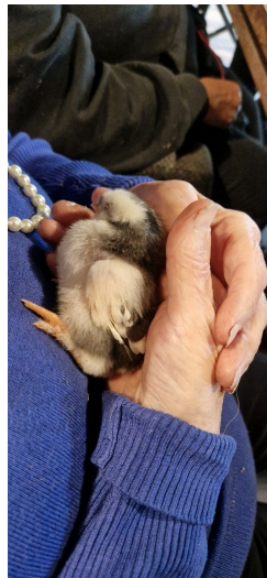
haan of hen?

Op 10 maart was het zo ver, onze koeien konden de wei weer in, alles was mooi opgedroogd in het land en er stond genoeg gras voor de koeien. We zaten eerste rang om de koeiendans te kunnen zien. Altijd leuk om alle gekke bokkesprongen te zien als de koeien onderweg zijn naar het weiland.