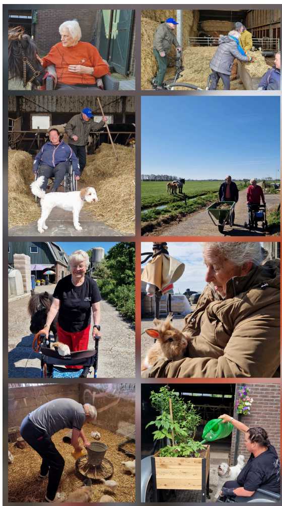
helpen op de boerderij

2025 was weer een mooi jaar met elkaar, onze groep deelnemers blijft stabiel en de meeste deelnemers zijn al heel wat jaren op de boerderij, een aantal zelfs vanaf het begin in 2017. Ook dit jaar spelen onze dieren weer een belangrijke rol met de activiteiten die we doen. De deelnemers helpen met de dagelijkse verzorging van de dieren, dit kan actief door echt met de handen in het hooi te zitten om de hooikar te vullen, of met de handen in de aarde om de moestuinbakken te onderhouden, het buiten zetten van onze pony Daantje is erg populair, maar ook als de deelnemer liever buiten een rondje loopt op het erf om bij de dieren te kijken/aaien of graag op 1 van de verschillende zitjes in de stal zit om te kijken naar de dieren kan dat ook. Er mag veel, maar er moet niks. In de stallen en ook daarbuiten is van alles te zien, naast onze melkkoeien en kalfjes zijn er ook kleinere dieren zoals katten, onze hond Sofie, pony Daantje, kippen, konijnen, cavia's, schapen, vogels en onze knappe kalkoen die altijd zijn best doet om aandacht te krijgen, hij pronkt en kwebbelt de hele dag door. De dieren worden flink verwend door onze deelnemers, zo is er altijd wel iemand die de schilletjes of de groenterestjes en oud brood bij de dieren wil brengen.