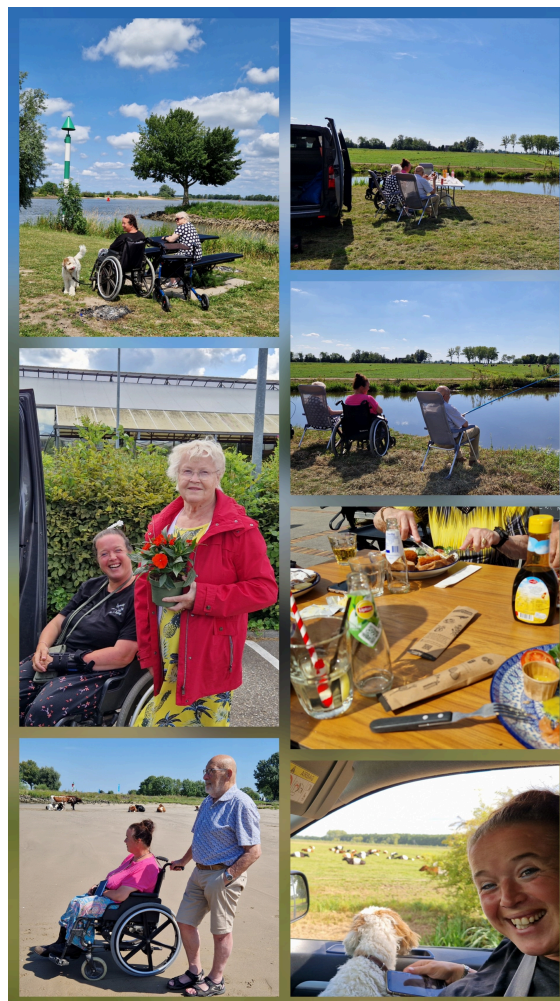
Uitjes met de zorgboerderij

Op de boerderij is altijd genoeg te doen en te beleven, maar we gaan ook graag op stap met zijn allen, dit jaar hebben we weer verschillende uitstapjes gemaakt. We zijn verschillende keren wezen picknicken, de ene keer aan de lek en de andere keer achterin het land aan de wetering waar we ook meteen konden vissen, 1 deelnemer wilde dit heel graag maar uiteindelijk wilde ze graag allemaal even vissen en niet zonder succes. Ook zijn we uit eten geweest op landgoed Mariënwaerd bij de stapelbakker, van pannenkoek tot broodjes kroket alles smaakt net zo lekker. Een uitje naar de action mocht ook niet ontbreken, we kijken iedere keer onze ogen uit zoveel spullen als daar in de winkel staan. Verder hebben we in Langerak kersen gehaald bij de kersenboerderij onder het genot van een kopje koffie of thee in de boomgaard met een bakje kersen konden we het wel even uithouden in de warmte. Als laatste uitje zijn we naar de kerstshow geweest bij de intratuin, erg mooi gemaakt en vooral de show met alle efteling figuren vonden de deelnemers erg mooi.