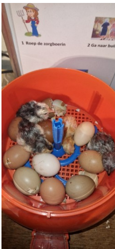
de kuikentjes komen uit het ei

Naast de lammetjes hebben we ook onze broedmachine weer gebruikt, we willen heel graag kleurleggers op de boerderij, we hebben de deelnemers de broedeieren laten zien, van blauw en roze naar donkerbruin. De deelnemers konden meekijken in de broedmachine tot het na 21 dagen eindelijk zo ver was en we de kuikentjes konden begroeten. Ze groeien erg goed en nu is het afwachten of ze eieren gaan leggen en daarbij welke kleur eieren of dat ze gaan kukelen.