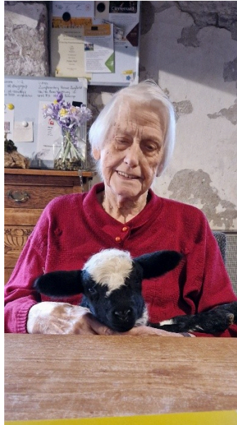
lammetjes knuffelen blijft leuk

Naast de lammetjes hebben we ook onze broedmachine weer gebruikt, we willen heel graag kleurleggers op de boerderij, we hebben de deelnemers de broedeieren laten zien, van blauw en roze naar donkerbruin. De deelnemers konden meekijken in de broedmachine tot het na 21 dagen eindelijk zo ver was en we de kuikentjes konden begroeten. Ze groeien erg goed en nu is het afwachten of ze eieren gaan leggen en daarbij welke kleur eieren of dat ze gaan kukelen.